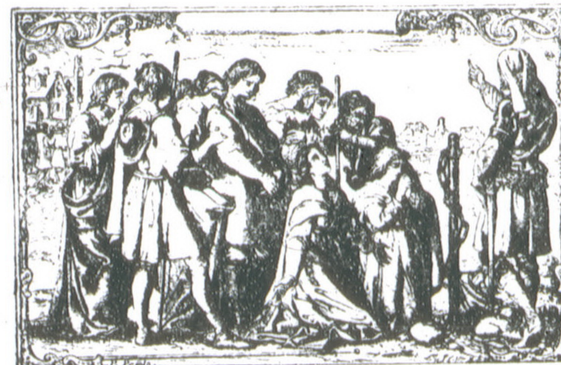
Пилигримы на мѣстѣ, гдѣ скончался Вѣрный!