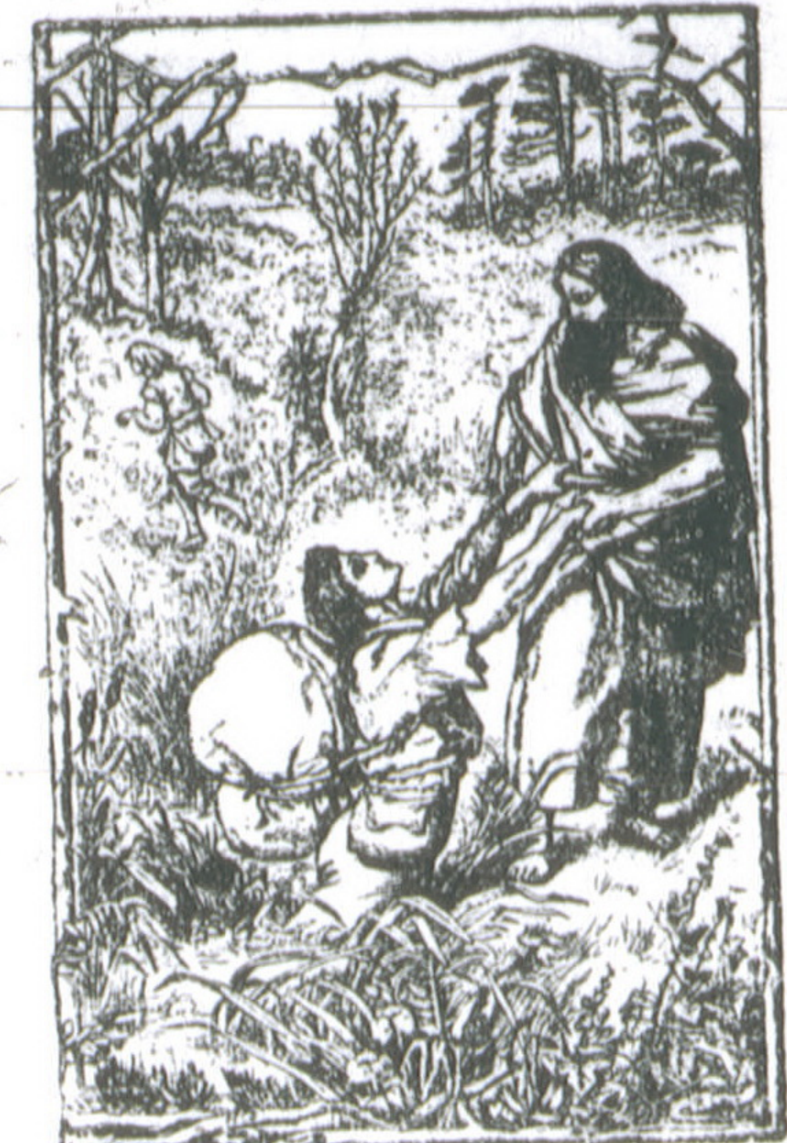
Помощь спасаетъ Христіанина изъ Тони Унынія.

4-хъ изъ 101-й картинъ - иллюстраціи въ книгѣ Путешествіе Пилигримма и Духовная Война.