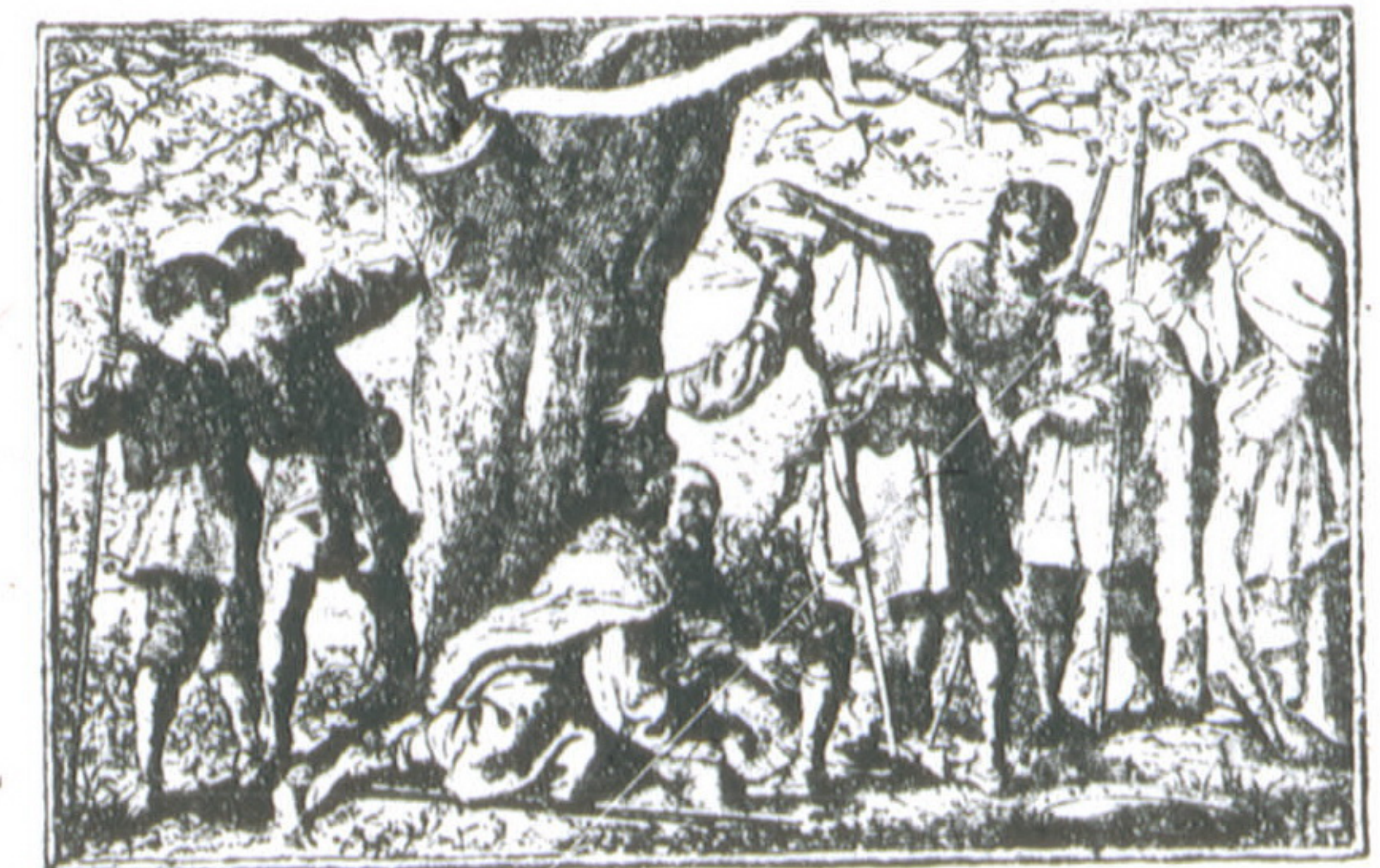
Честный спитъ подѣ Дубомъ.

Сборники Гусли , и Пѣсни Христіанина , Тимпаны , Кимвалы и Заря Жизни переплетены въ одну книгу подѣ названіемъ Духовныя пѣсни въ полу-шагреновомъ переплетѣ. Цѣна 2 р. 50 н., въ кожаномъ мягкомъ переплетѣ съ краснымъ обрѣзомъ 3 р. 30 н., то-же золотой обрѣзъ 4 р. 50 н., то-же съ загнутыми краями 5 руб.