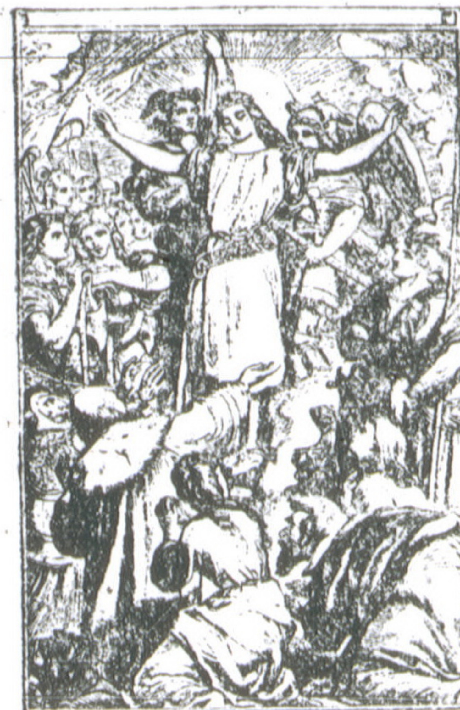
Какъ Я живъ! и вы живы будете. (Сказаль Еммануиль).

Полные комплекты журнала „ХРИСТІАНИНЪ“ за 1906 г., 1907 г., 1908 г. и 1909 г. можно получать съ перес. по цѣнѣ 3 р.; для Сибири и Манчжуріи 3 р. 50 к. Всѣ четыре года высылаются за 10 руб., для Сибири и Манчжуріи 12 руб.